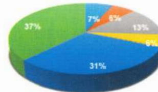
FAM 2024 UTA